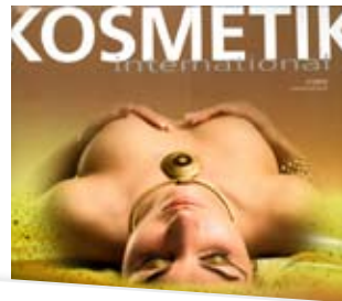
Environ's Body Profile ist eine Hightech-Pflege gegen Orangenhaut. Kosmetik International, 02/08