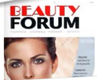
Männersache. Die dreiteilige Pflegeserie Men's Range von Environ besteht aus Duschgel, Rasieröl und Gesichtspflege. Beauty Forum, 05/08