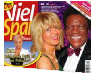
Traumhafte Bräune ohne Sonne: Tolle Tönung. Environ's Self Tan baut schrittweise eine lang anhaltende, intensive Bräune auf. Viel Spass, 03/08