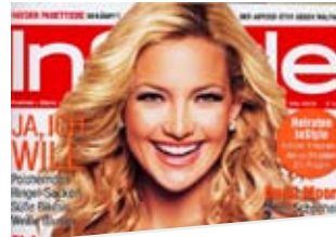
Die meisten cremen viel zu sparsam. Dabei ist Schutz so wichtig für das schickste Accessoire des Sommers: Eine knackige Bräune. Multitalent: RAD, LSF 16 von Environ . InStyle, 05/08