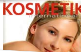
Environ Men's Range: Enthalten sind u.a. Extrakte aus Honeybusch- und grünem Tee sowie Jojoba-, Oliven-, Avocado- und Pfefferminzöl. Kosmetik International, 05/08