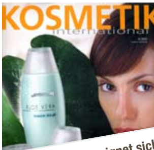
Environ RAD SPF 16 eignet sich für den täglichen Gebrauch sowie alle Hauttypen und Altersgruppen. Kosmetik International, 04/08