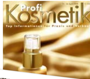
Sommerteint das ganze Jahr: Environ's Self Tan tönt die Haut gleichmäßig und schrittweise. Profi Kosmetik, 04/08