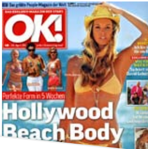
Mann, siehst du gut aus! Bei trockener Haut: Shaving Oil von Environ . OK!, 04/08