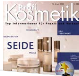
Anti-Cellulite: Makellose Silhouette mit Environ's Body Profile Profi Kosmetik, 06/08